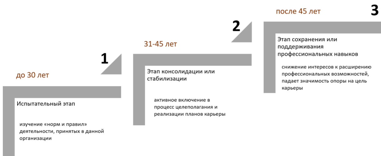
Рисунок 1. Этапы развития карьеры

Как видно на рисунке 1 на каждом этапе сотрудник сталкивается с необходимостью решать определенные задачи как трудового, так и личностного характера: от необходимости адаптации к корпоративной культуре организации до расширения возможностей и полномочий.